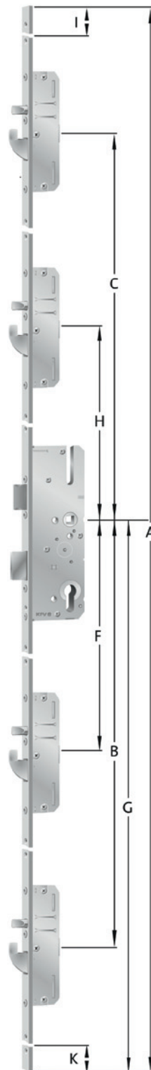
Schwenkriegel mit oder ohne Rundbolzen